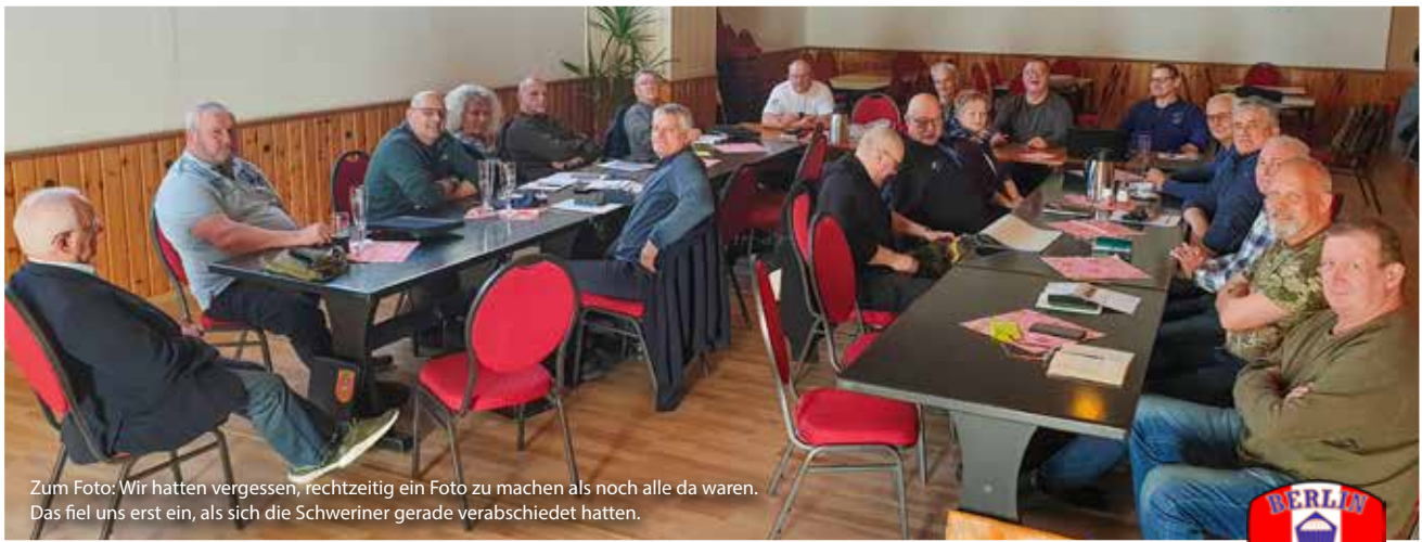
Zum Foto: Wir hatten vergessen, rechtzeitig ein Foto zu machen als noch alle da waren. Das fiel uns erst ein, als sich die Schweriner gerade verabschiedet hatten.